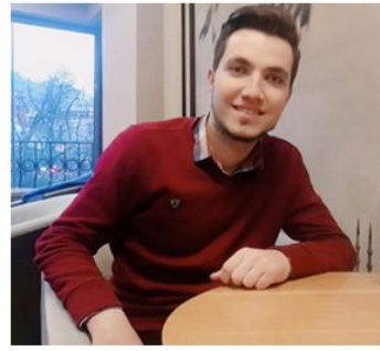
"BİR LISAN BİR İNSAN"

Dünyada ne yazık ki herkes aynı dili kullanmıyor. Bu yüzden sadece kendi ana dilimizi bilmek yeterli olmuyor. Hayatınızda çoğu yerde karşı karşıya kalacağınız keşke dil bilseydim diyeceğiniz işte o olmazsa olmaz faydaları: